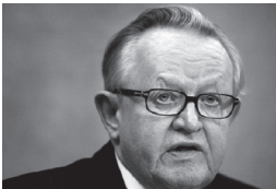
● นายมาร์ตติ อาร์ทิซารี

“สื่อที่เกี่ยวข้องกับเหตุการณ์ความขัดแย้งและความรุนแรงทางการเมืองที่ผ่านมาได้เน้นการนำเสนอเพียงด้านเดียว จนทำให้ความขัดแย้งขยายวงกว้างและหยั่งรากลึกถึงสู่ทุกระดับของสังคม ทุกวันนี้จึงมีการวิพากษ์วิจารณ์จากสังคมถึงจรรยาบรรณในฐานะสื่อมวลชนว่า มีการเลือกข้างและเลือกใช้ข้อมูลบางประการในการนำเสนอ บางครั้งมีการเบี่ยงเบนประเด็น หรือมีการให้ข่าวสารข้างเดียวซึ่งในบางกรณีทำให้เกิด การบิดเบือนความจริง นอกจากนี้ สื่อบางสำนักยังสร้างวาทกรรมแห่งความเกลียดชัง จนกลายเป็นการยั่วยุ และสร้างบรรยากาศแห่งความไม่เป็นมิตรระหว่างกันในสังคม”