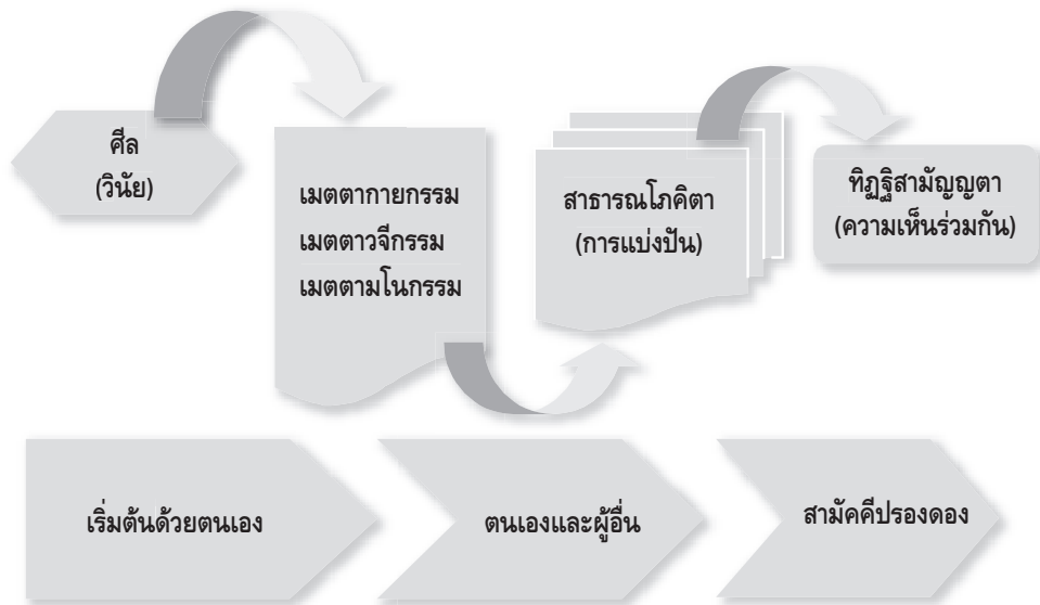
ภาพที่ ๑ กระบวนการสาราณียธรรม ๖ ในการพัฒนา ๔ ชั้นปรองดอง

“อตตาทิ อตตโน นาโถ” ต้องอยู่ในใจตลอด เพราะศีลต้องอยู่ที่ตนเอง สมบัติต้องอยู่ที่ตนเอง ปัญญาต้องอยู่ที่ตนเอง ความสุขและความทุกข์ก็อยู่ที่ตนเอง ทุกสิ่งทุกอย่างอยู่ที่ตนเองเป็นผู้กำหนดเพราะชีวิตจิตวิญญาณนี้เป็นของตนเอง ถ้าพิจารณาตามหลัก “สาราณียธรรม ๖” เพื่อให้เกิดความสามัคคีปรองดองในสังคม ทุกคนในสังคมต้องเริ่มปฏิบัติจากตนเองถึงจะส่งเสริมผู้อื่นตามกระบวนการภาพที่ ๑