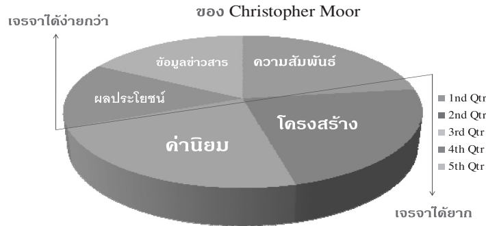
แผนภาพ ๑ แสดงสาเหตุของความขัดแย้งด้านต่างๆ

๑) ด้านข้อมูล (Data Conflict) ได้แก่ ข้อมูลขัดกัน ขาดข้อมูล เข้าใจผิด ขาดการสื่อสาร หรือสื่อสารไม่ถูกต้อง สับสนเรื่องหน้าที่ มุมมองต่างกันในเรื่องของข้อมูล