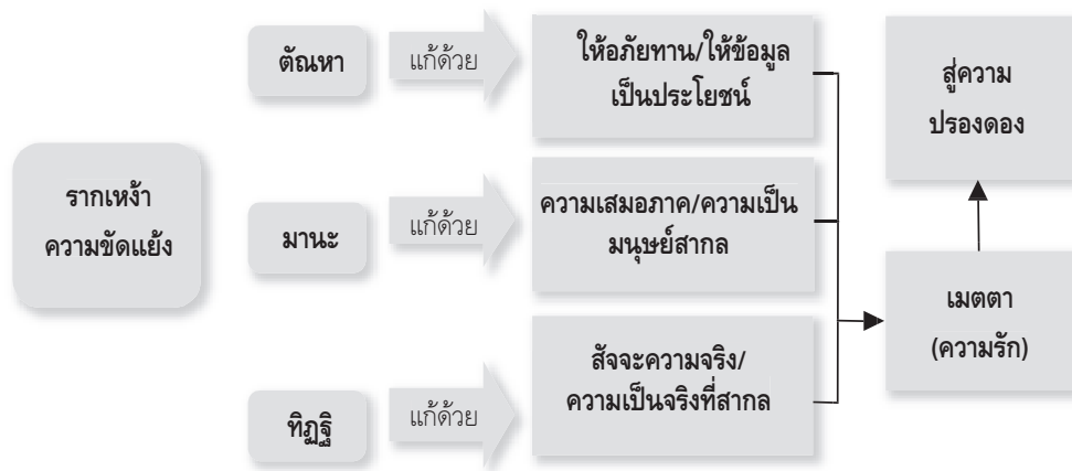
แผนภูมิ ๒ : แสดงการจัดรากเหง้าของความขัดแย้งจากการสื่อสารทางการเมืองด้วยเมตตา

จากภาพเป็นการแสดงให้เห็นถึงหลักการแก้ปัญหาความขัดแย้งในสังคม อาทิ ปัญหาการสื่อสารทางการเมือง เมื่อวิเคราะห์วิธีการแก้ไขปัญหาก็จะแบ่งได้ตามรากเหง้าของปัญหา คือ กิเลสทั้ง ๓ ตัว ๔๑ อันได้แก่ ตัณหาที่จะแก้ได้ด้วย การให้ทาน คือการให้ความรู้ ให้อภัยต่อกัน ส่วนมานะแก้ได้ด้วย ความเห็นว่ามีมนุษย์มีความสากลเหมือนกัน และทิฏฐิแก้ได้ด้วย ความเห็นด้วยกับหลักการเดียวกัน ที่ว่าความเป็นจริงสากล แต่เมื่อสังเคราะห์วิธีการแก้ไขปัญหาความขัดแย้งแล้วสามารถรวมไว้ที่แนวคิดเรื่องเมตตาที่เป็นสากล เพราะเมตตานั้นเป็นพื้นฐานของคุณธรรมอื่นๆ ในการทำดี ช่วยจัดความขัดแย้งทั้งปวงได้อย่างแท้จริง และทำให้สังคมอยู่ร่วมกันได้อย่างสงบสุข